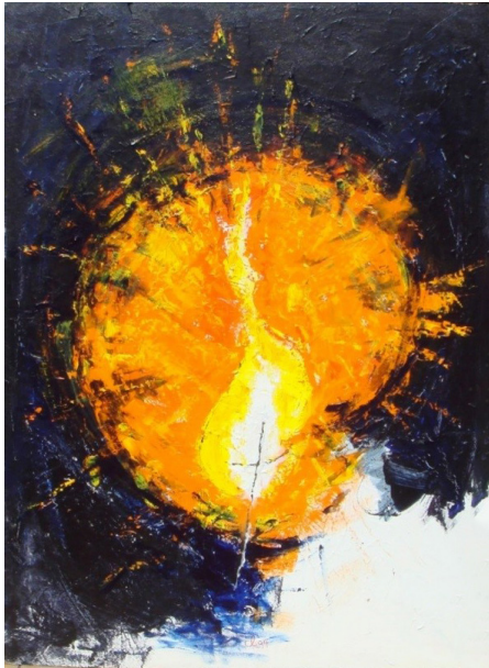
Figur 19 "Lyset skinner i mørket", Ib Klausen 1999.

er det, at det allerhelligste i Jerusalems tempel ikke var oplyst, men må antages at have henligget i mørke (Anden Krønikebog 3,8).