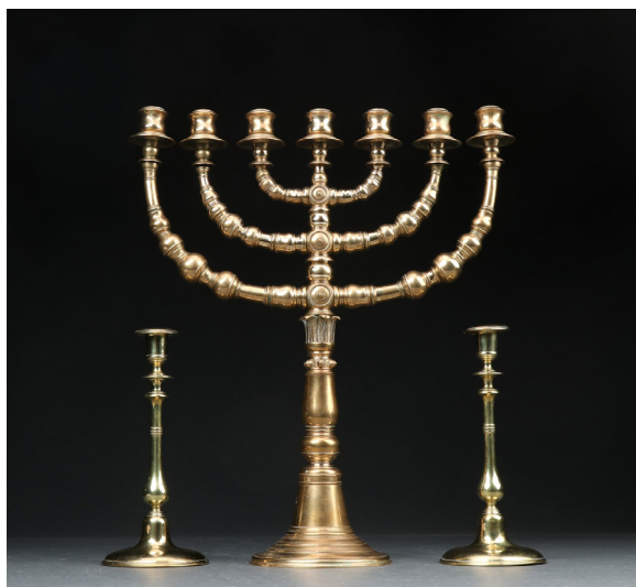
Figur 3 Grundtvig-stagen (og to samtidige stager).

ny for halvtredsindstyve år siden, da livet atter vakte gennem Deres røst. Måtte De endnu leve længe iblandt os og se dette lys gå altid klarere og klarere op for menigheden, så troslivet udvikle sig hos os til det kærligste samfundsliv! Dette ønske vil vi alle, der her bringer Dem vore gaver som tegn på vor levende og dybe påskønnelse, trofaste kærlighed og varme hengivenhed". Også kultusminister D.G. Monrad (tidligere