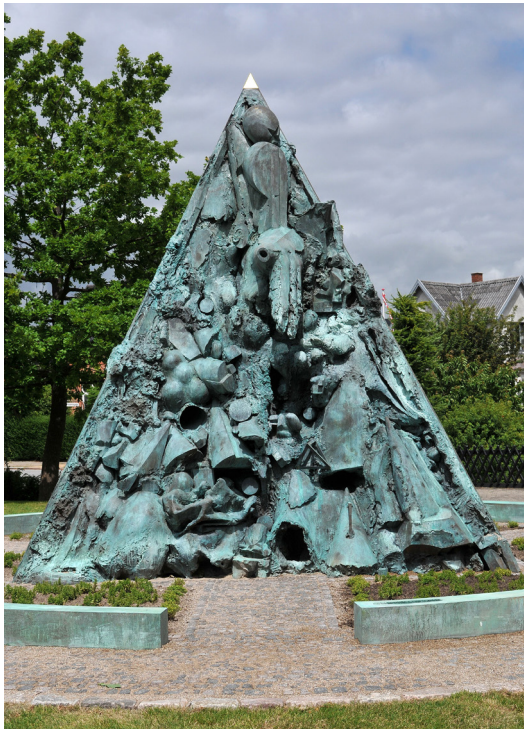
Figur 24 Hein Heinsen 2014, "Gud-Helligånd". Nykøbing-Falster Bispegård.

og ud igen, uden at krydse nogle kanter, en slags én-sidet objekt. Skovsgaard nævner også dén mulighed, at der kan være tale om englen fra Påskeberetningen.