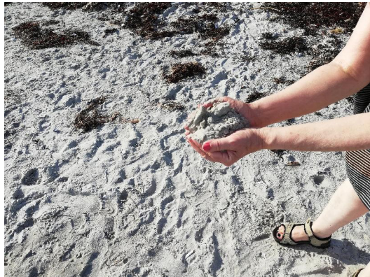
Figur 17. Der er flere stjerner i universet, end der er sandkorn på alle strande på hele jorden.

Én har sagt, at hvis man ejer mindre end otte ting, er man fri for bekymringer. Så må Diogenes have været uden bekymringer. Som en anden har sagt: “At være rig er ingen skændsel – men kun at være rig, dét er en skændsel” . Eller som atter én har sagt: