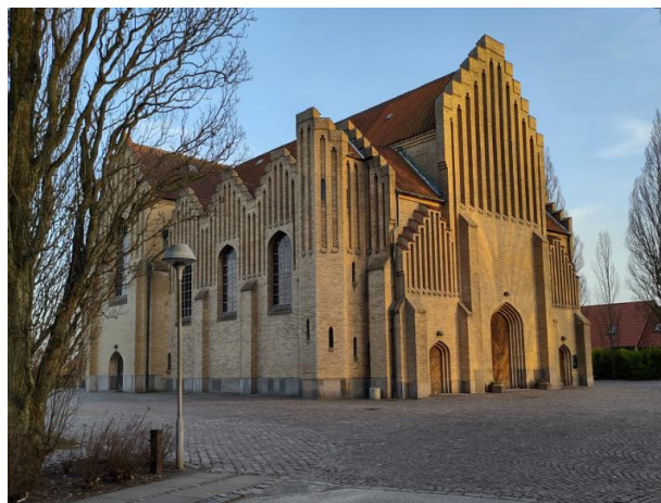
Figur 14 Christianskirken i Sønderborg.

Der er en afgørende pointe ved Gotfred Mortensens mosaik i Christianskirken i Sønderborg. Her skal vi omkring Den sekstakkede stjerne – også kaldet Davidsstjernen eller Betlehemsstjernen. Den er egentlig sammensat af to figurer: En guddommelig