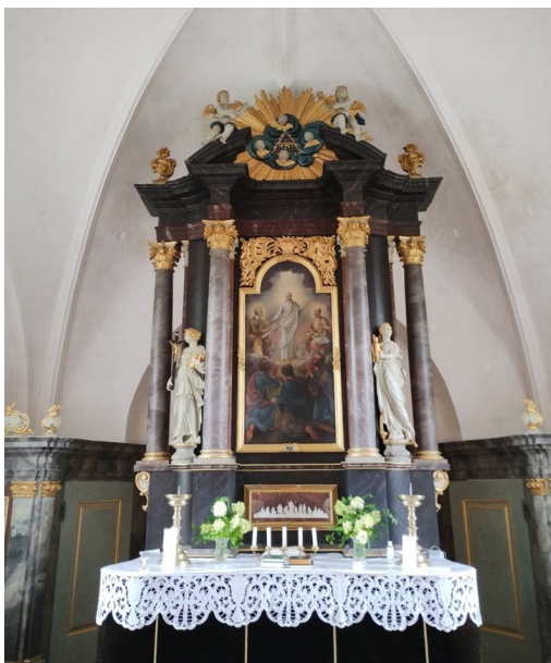
Figur 12 Granslev Kirke, alterpartiets topstykke. Tetragram med vokaler.

blev der opført et mindesmærke, Konstantins Triumfbue, der beskriver Konstantins sejr som et resultat af guddommelig indgriben. Ejendommeligt nok viser dette monument ikke nogen åbenlys kristen symbolik. Ifølge overleveringen blev Konstantin selv først døbt på sit dødsleje.