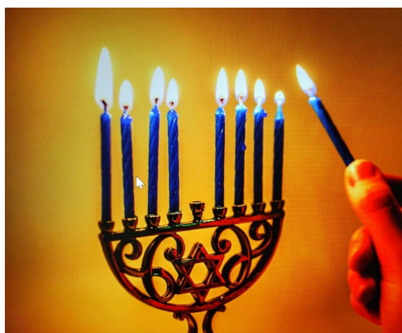
Figur 2 Moderne udgave af hanukkah-stagen. https://joediskinfo.dk/vidensbank/yndlings-helligdag.

kaldes på hebraisk menorahen – på hebraisk: המנורה ("ham'nora") – og er omtalt i Anden Mosebog kapitel 25. Ifølge beskrivelsen i Bibelen var den fremstillet af guld og skønnes at have haft en vægt på ca. 30 kilo. Stadig ifølge den bibelske fortælling stod stagen i templet i Jerusalem. Templet blev ødelagt af romerne i år 70 efter Kristus. Forinden plyndrede romerne templet og bragte bl.a. den syvarmede lysestage til Rom. Til minde om disse afgørende begivenheder lod romerne opføre den såkaldte Titustriumfbue på Forum Romanum. Her kan man endnu se en relieffremstilling, hvor soldaterne bringer krigsbyttet ind i byen, herunder den syvarmede lysestage. Hvad der sidenhen skete med menorahen, vides ikke. En legende hævder, at den er gravet ned et sted ude i Tiberen. Det mest sandsynlige er måske, at den blev smeltet om. En rettroende jøde går ikke igennem Titusbuen og nægter således at se fremstillingen af, hvordan de romerske soldater slæber tempelskattene fra det hellige land til det romerske magtcentrum i år 70. Skulle menorahen blive genfundet – og det er vel ikke en umulighed – vil det være en sensation og som følge af stagens symbolske indhold have enorm betydning – især for staten Israel, hvor den fra statens oprettelse i 1948 på ny kom i centrum. Om lysestagen skulle "leveres tilbage", hvis den dukker op igen, er en helt anden sag.