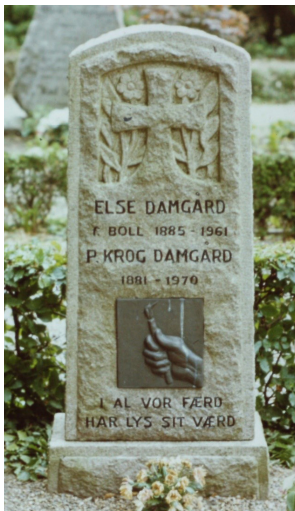
Figur 20 Morsø Frimenigheds Kirkegård. Gravstenen findes ikke mere.

bemærkelsesværdigt. På vore breddegrader veksler det fysiske lys som bekendt med sommertid og vintertid ved henholdsvis St. Hans og jul, nærmere bestemt omkring 21. juni og 21. december. På kalenderen markeret med dagen for Johannes Døberen (lig med St. Hans) og Mesterens fødsel. Deres mindedage er således henlagt til nogle få dage efter sommer- og vintertid – for Johannes Døberens vedkommende til den 24. juni og til dels fejret aftenen før, nemlig den 23. juni med St. Hans-bål, og for Mesterens vedkommende med fejringen af julen. Symbolikken har ikke mindst hentet sit indhold fra Johannesevangeliet (3,30), hvor det hedder: "Han bør vokse, men jeg blive mindre". Hvad sker der med dagene fra St. Hans? De bliver "mindre", lyset aftager. Selv om sommeren kun lige er begyndt, går det altså mod mørkere tider, men munder ud i