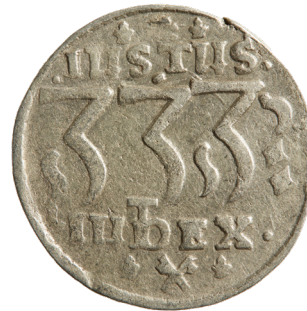
Figur 8 Christian IV, 2 mark, Glückstadt, 1645. "Hebræermønt", diameter 3 cm, revers. Foto: Rasmus Holst Nielsen, Nationalmuseet. Gengivet med tilladelse.