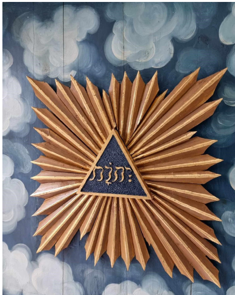
Figur 11 Lydhimlen over Sjørslev Kirkes prædikestol. Ligesidet trekant med Guds navn, tetragrammet, på hebraisk med vokaler.

Eusebius fortæller videre, at Kristus viste sig for kejseren med befaling om at benytte korstegnet som beskyttelse mod fjenden. Derfor lod Konstantin fremstille den såkaldte standart, det vil sige en fane, der var udformet som et kors. På spidsen af fanestangen satte han Kristi monogram, som måske kunne have den udformning, der ses i triangelen i Christianskirken. Andre udformninger er også mulige, men i alle tilfælde med anvendelse af bogstaverne chi og rho. Endvidere fortælles det, at Kristi monogram også blev sat på soldaternes skjolde. Efter indtagelsen af Rom skulle Konstantin have ladet rejse en statue af sig selv med et kors i hånden og en indskrift, der fortalte, at han ved dette tegn havde befriet byen. I forbindelse med fejringen af sejren