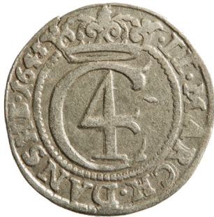
Figur 8 Christian IV, 2 mark, Glückstadt, 1645. "Hebræermønt", diameter 3 cm, avers.

interessant er det, at en del af de danske middelalderkirker gengiver det hebraiske Guds-navn på altertavlen, ofte endda anbragt i en ligesidet trekant.