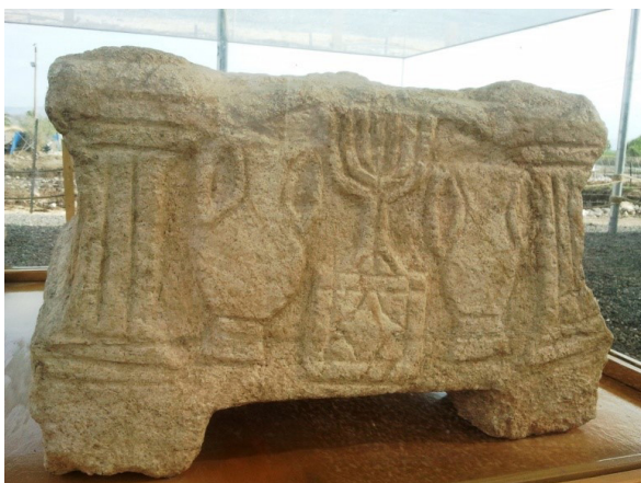
Figur 5 Menorahen på en sten fra synagogen i Magdala ved Genesaret Sø.

Symbolikken bag livets træ rummer yderligere et indhold, som skal ses i sammenhæng med forestillingerne om et verdenstræ, der forbinder jord og himmel. Denne