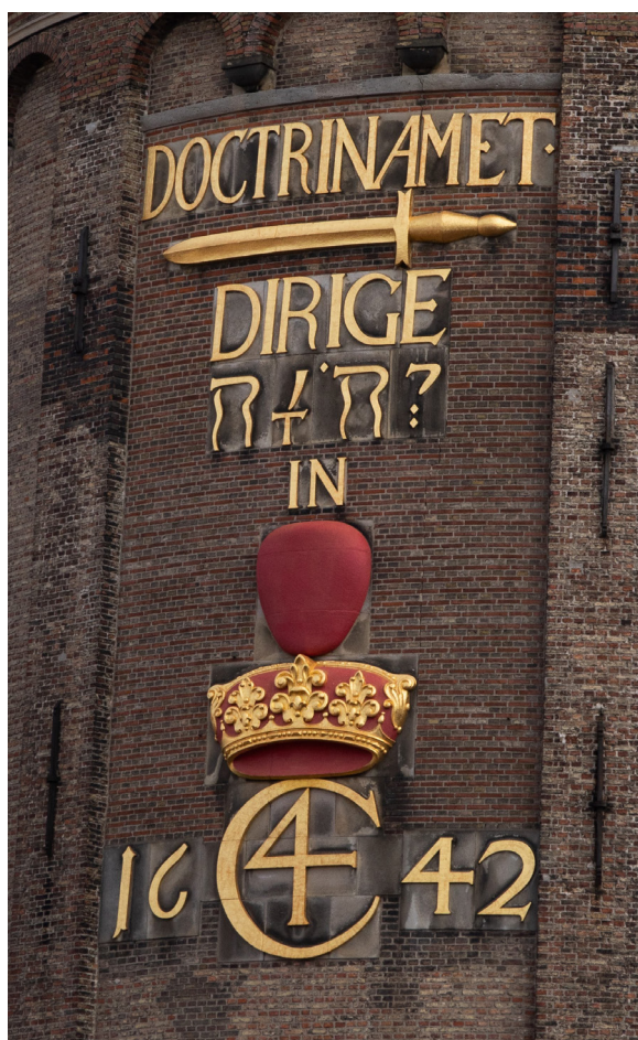
Figur 6 Rebus på Rundetaarn.

En rebus indeholder ofte en række af symboler, som kan åbne for nye udsigter. Et kendt eksempel herpå er den rebusagtige indskrift på Rundetaarn i København. Bag opførelsen af denne markante bygning står den danske konge Christian IV. Læsningen af Rundetaarns rebusagtige indskrift vanskeliggøres af, at den både indeholder symboler, latinsk tekst og et hebraisk ord. I det følgende bringes forklaringen på Rundetaarns indskrift for at illustrere endnu et hjørne af det univers, der åbner sig, når man beskæftiger sig med symbolsproget.