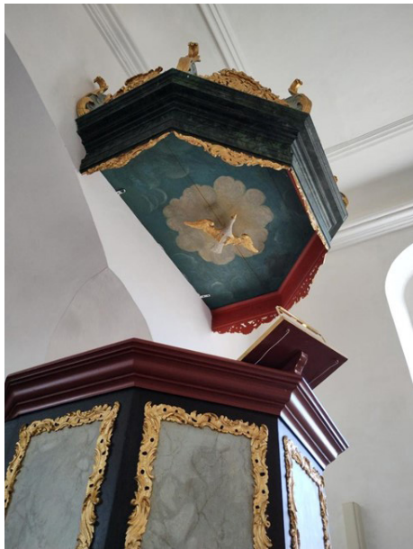
Figur 13 Granslev Kirke. Helligånds-due under prædikestolens lydhimmel.

Den flyvende due som et billede på Helligånden stammer fra beretningen om Jesu dåb i Jordanfloden (Mathæusevangeliet 3,13-17). Her fortælles det, at da Jesus steg op af vandet efter at være blevet døbt af sin slægtning Johannes Døber, kom Helligånden over Ham som en due. I den kirkelige kunst flyver Helligånds-duen derfor som oftest