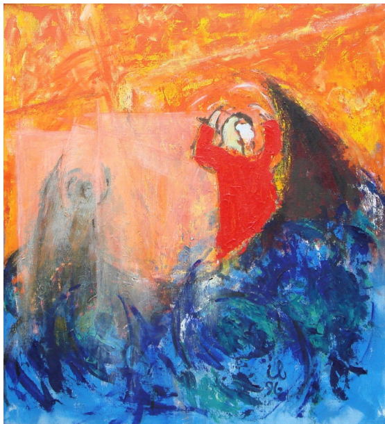
Figur 18 ”Stormen på søen», Ib Klausen 1996 .

søen” (Mathæusevangeliet 14,22-33) udgør også en del af baggrunden for betegnelsen ”skibet” om kirkebygningens største rum.