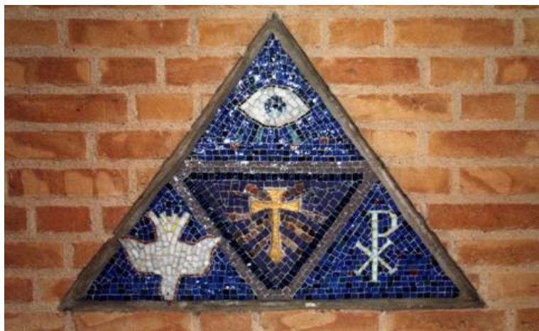
Figur 10 Christianskirken i Sønderborg. Mosaik udformet af Gotfred Mortensen 1957.

det vil sige Hans kors, og ved Helligånden som et tov ". Med dette markante citat samles store dele af stensymbolikken. En lignende tankegang afspejles i Den Danske Salmebog nr. 289, hvor det hedder: "Nu bede vi den Helligånd at sammenknytte os ved troens bånd" – dén tankegang, at Helligånden så at sige er "rullet ud som en snor"