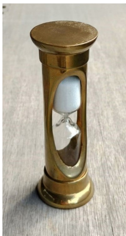
Figur 15 Timeglasset.

Aristoteles taler om, at mennesket er behersket af instinkter, trang og tilbøjeligheder. Disse naturdrifter kalder han ”páte” – af græsk: πάθη (flertal), πάθος, ”pathos” (ental). Vi kender det fra ordet ”patetisk”, som har samme rod i det græske sprog, og som kan betegne det følelsesladede, dét at være grebet eller at være i affekt, det lidenskabelige eller ligefrem det svulstige. I den mere positive betydning kan ”pathos” også stå for det højtidelige eller det ophøjede. Aristoteles siger, at når mennesket ved hjælp af tanken og viljen bearbejder disse naturdrifter, bliver de til ”eté” (græsk: ἠθῆ) med samme rod som ”ethikós” (græsk: ἠθικός), som hos os bliver til ”etik” og ”etikette”.