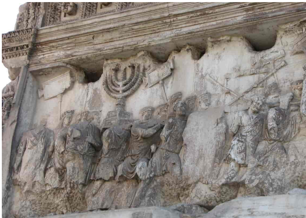
Figur 4 Fra Titusbuen på Forum Romanum i Rom. https://denstordanske.lex.dk/Titusbuen.

biskop over Lolland-Falsters Stift) deltog ved hyldningen på en ganske særlig måde. I sin tale til Grundtvig, sagde Monrad, at da de to store salmedigtere Thomas Kingo og H.A. Brorson begge fik rang af biskopper, "havde Hans Majestæt Kongen anset det for ret at give den tredje store salmedigter, pastor Grundtvig, rang med Sjællands biskop, for at det kunne vides, at Majestaten ikke mindre end hans forgængere på Danmarks trone satte pris på en udmærket digterisk begavelse, anvendt i kirkens tjeneste" .