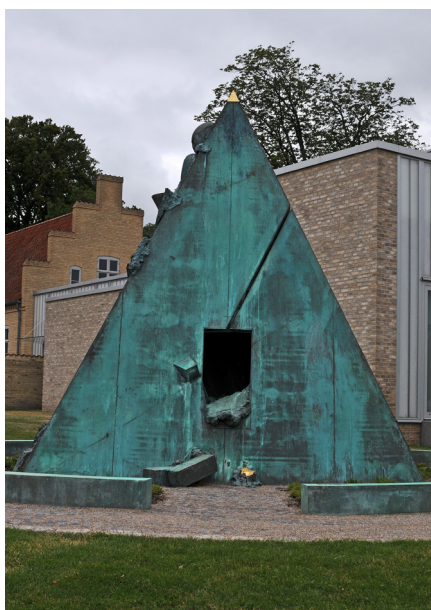
Figur 23 Hein Heinsen 2014, "Guds-Søn". Nykøbing-Falster Bispegård.

Kigger man nærmere ind i hullet, ser man noget, der ligner et horn eller en snegl. I Skovsgaards tolkning er det Higgs partikel. Det er det fysiske fænomen, som fysikeren Peter Higgs regnede sig frem til for ca. 60 år siden, og som i 2012 blev dokumenteret som den partikel, der giver andre partikler masse. For Skovsgaard er det et billede på skabelsen eller skaberen, som vi ikke kan trænge ind i.